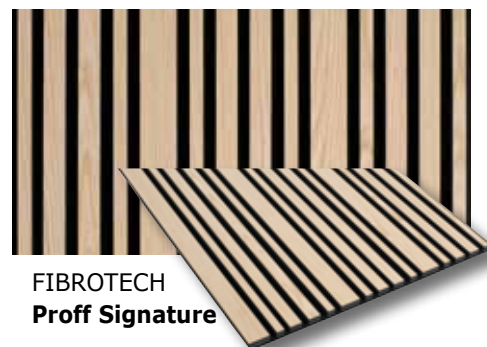
FIBROTECH Proff Signature