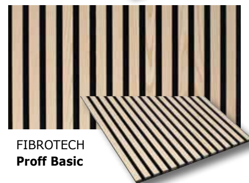
FIBROTECH Proff Basic